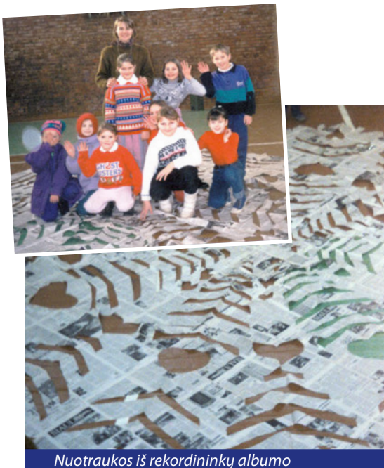
Nuotraukos iš rekordininkų albumo