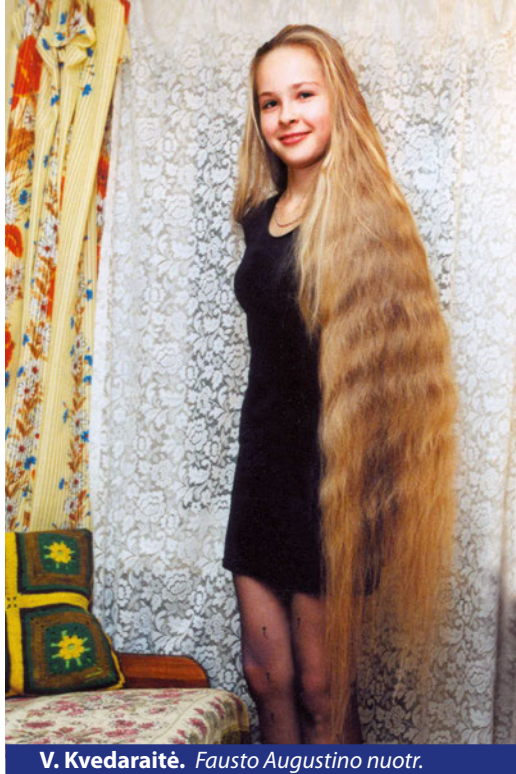
V. Kvedaraitė.