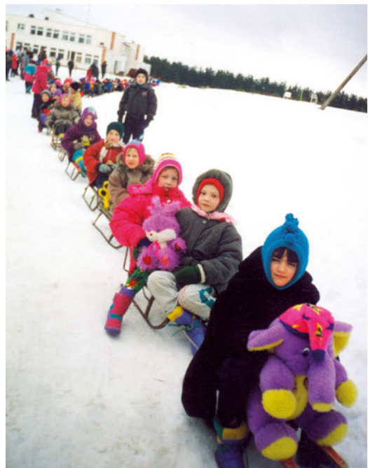
Nuotrauka iš rekordininkų albumo

Ignalinos r. Vidiškių vidurinės mokyklos (dabar Ignalinos r. Vidiškių gimnazija) pradinė klasių mokiniai 2000 m. vasario 11 d. sujungė į vieną 56 rogučių 60 m ilgio sąstatą ir patraukė jį 74 m. Žiemos palydėtuvių šventėje 2003 m. vasarį Rokiškio pradinės mokyklos (dabar Rokiškio Juozo Tūbelio progimnazija) mokiniai į 76,9 m ilgio rogučių sąstatą, pavadintą traukiniu, sujungė 104 rogutes. Kai kurie mokiniai atsitempė ir po dvi rogutes – sau ir jų neturinčiam draugui. Rogutės mokyklos stadione buvo sujungtos viena prie kitos be tarpų, bet šio rogučių sąstato niekas nepajėgė pajudinti iš vietos.