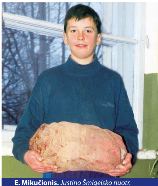
E. Mikučionis.