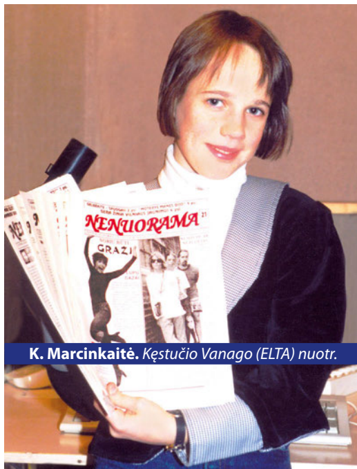
K. Marcinkaitė.

iš Vilniaus 1993 m. įsteigė (steigimo liudijimas Nr. 1568) ir rugpjūčio mėn. išleido pirmąjį aštuonių puslapių vaikų kūrybos mėnraščio „Nenuorama“ numerį.